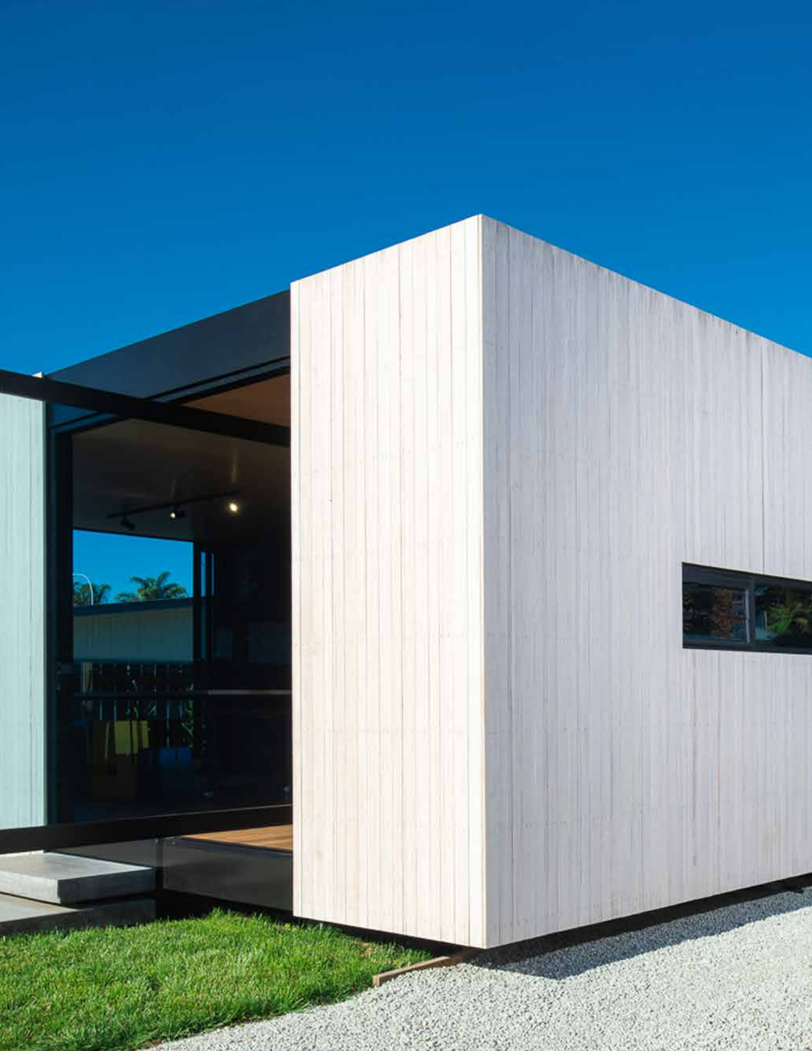
The Balance Studio. SiOO:X Vulcan Panel på ett Abodo Wood-projekt på Nya Zeeland.