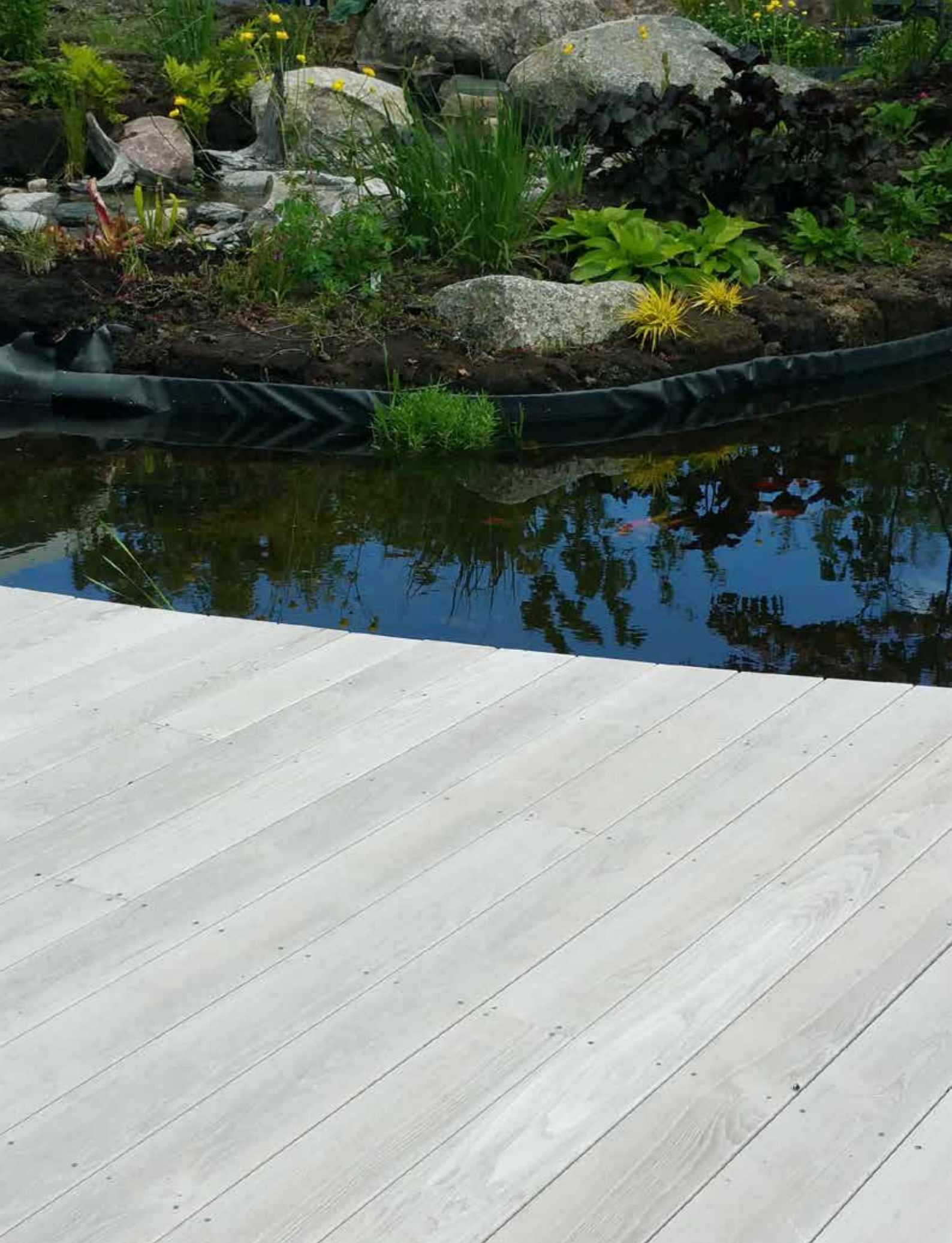
Sioo:x-behandlad altan, ( i Svedala) i TermoAsk ca 9 mån efter behandling. På Vulcan Trall uppnås ett liknande utseende.