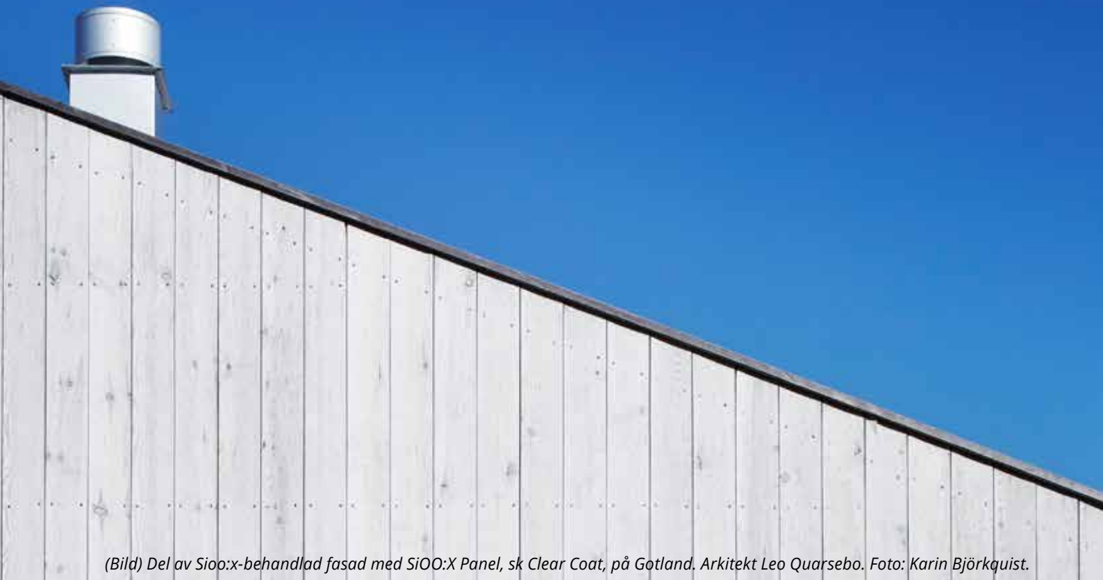
(Bild) Del av SiOO:x-behandlad fasad med SiOO:X Panel, sk Clear Coat, på Gotland. Arkitekt Leo Qursebo.